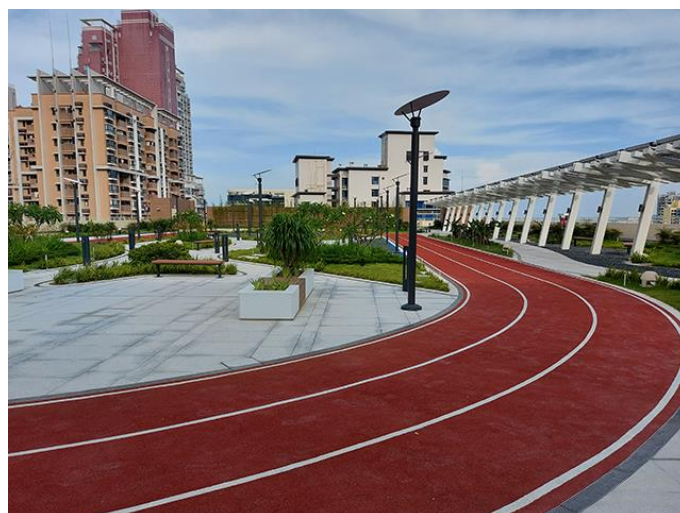
圖 6 望廈體育中心休閒運動區