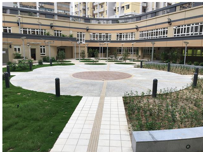
圖 4 望廈社屋綠化休憩區