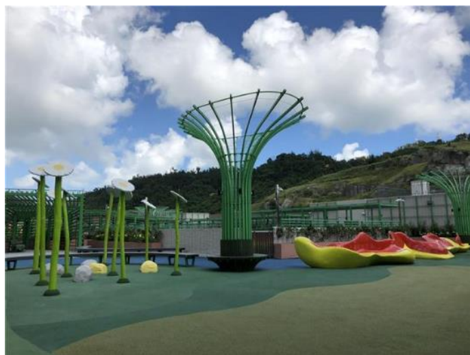
圖 1 石排灣綜合社區大樓天台休憩區