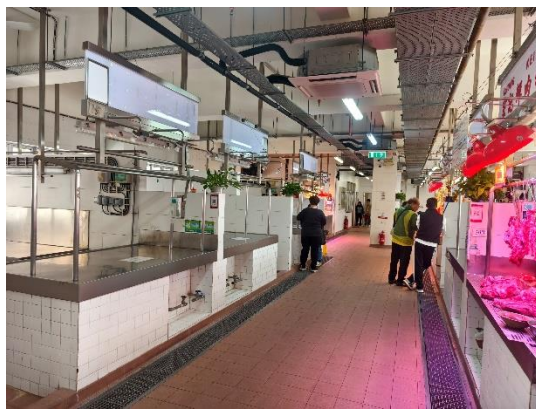
台山街市二樓僅有五個檔口營運，其他則空置。