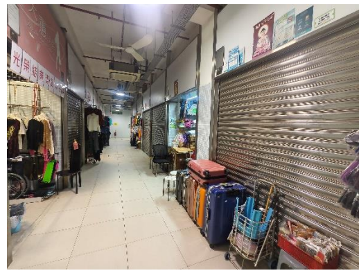
商戶反映僅靠做“老街坊”生意維持營運。