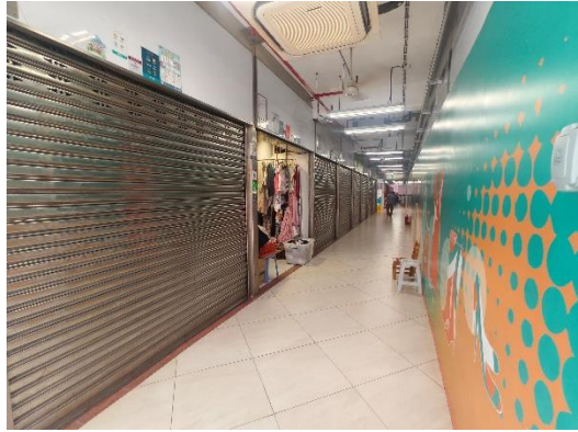
祐漢街市成衣攤位空置率十分高。